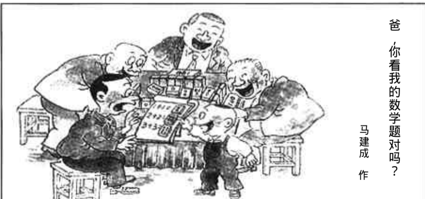
爸,你看我的数学题对吗? 马建成作

位,力争在2—3年时间逐步退出粮田面积,全部发展成高效农业和经济作物。镇里积极兴建龙头项目,今年颜徐一建投资600万元扩建3000吨恒温库,驰中集团投资500万元扩建2000吨乌鸡系列产品深加工项目。政府不仅在信息、资金上大力支持,而且千方百计给这些产品找“婆家”,与外地客商建立生产联产联销合同,确保农户的利益不受损失。(周海燕 蒋涛)