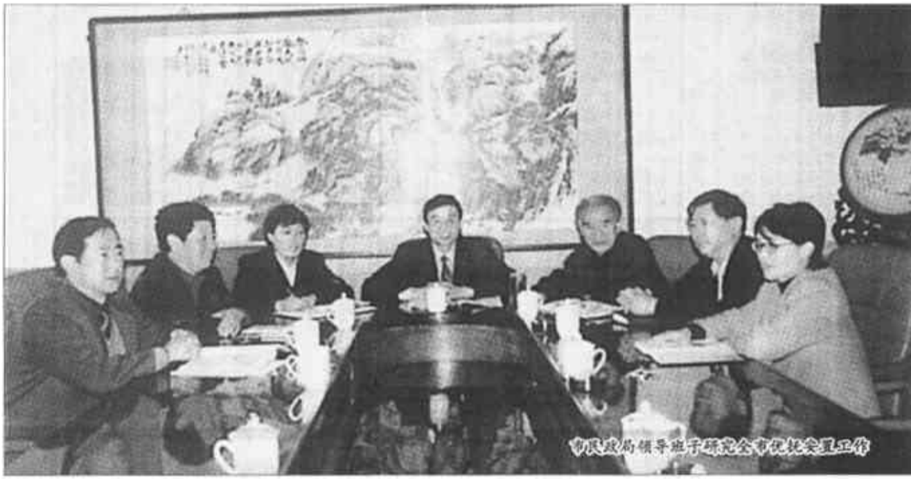
市双拥办领导于研究会有关社区工作

四、开展结对帮扶，实现拥军优属社会化。我市通过实施“结对工程”，动员全社会力量与驻军单位及优抚对象结对帮扶、办实事，实现了拥军优属由政府行为向全社会行为的转变。目前，全市已有110多个单位与10多个驻军单位，340个乡镇部队、2070名党员干部与8468户优抚对象结成对子，共为驻军单位和优抚对象解决实际困难3000多件，赠送款物累计达260多万元。目前全市以解决老、弱、伤、病、残优抚对象各类困难为内容的“一助一”的社会帮扶活动已全面展开。（优抚安置科）